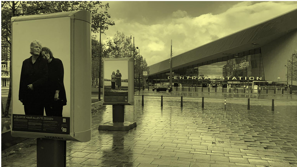
12 november 2020, Foto van de rondreizende buitenexpositie 'WIJ... doorbreken de cirkel van geweld' (hier op het Kruisplein in Rotterdam waar de expositie gelanceerd werd en van 12-11-2020 t/m 08-12-2020 te zien was)